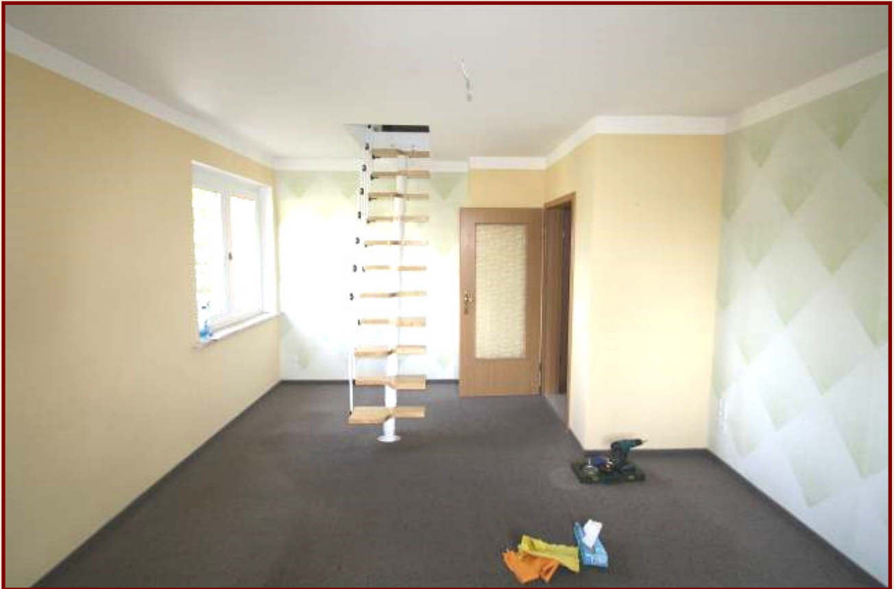
Wohnzimmer mit Aufgang zum Kinderzimmer