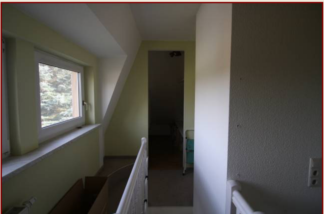
Kinderzimmer, hinterer Teil