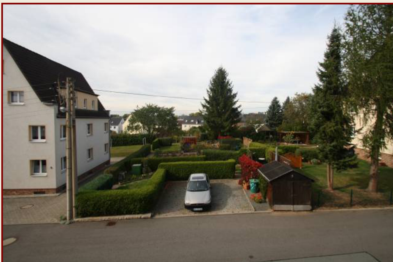
Blick zur Straße