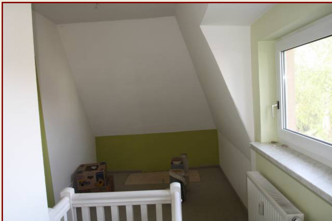
Kinderzimmer, vorderer Teil